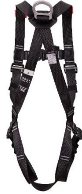
DAKOTA FAST Back / Arka

(EN) The Notified body in charge of EU type examination /