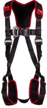
DAKOTA FAST COMFORT Front / Ön

(EN) Nominal Working Weight / (TR) Çalışma Yüğü: 150 kg