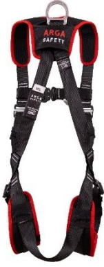
DAKOTA FAST COMFORT Back / Arka