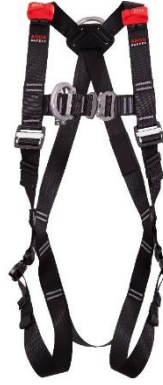
DAKOTA FAST Front / Ön