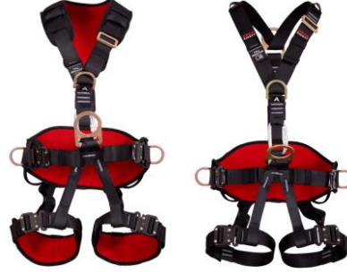
(EN) Figure-5 (TR) Şekil-5

F (EN) Sit Harness (Suspension) (EN 813:2008) (TR) Oturak Kemer (Süspansiyonlu) (EN 813:2008)