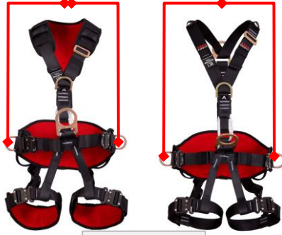
(EN) Figure-4 (TR) Şekil-4

E (EN) Work Positioning (EN 813:2008) (TR) Konumlandırma Kemer (EN 358:2018)